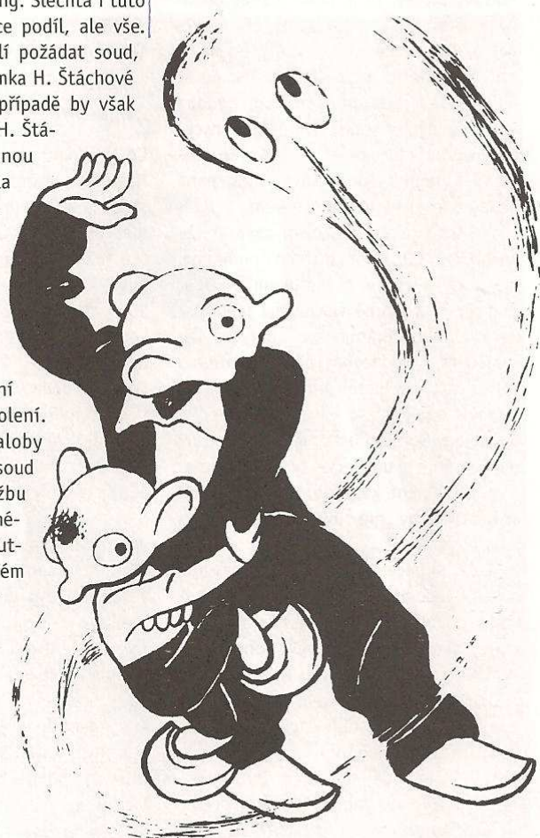
Spejbl a Hurvínek v kresbě Jiřího Trnky