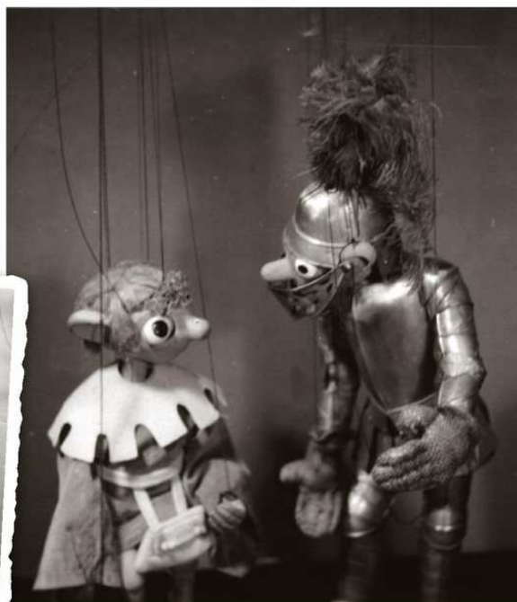
Také hra Ať žije zítřek z roku 1941 se dostala do hledáčku nacistické cenzury

Kvůli horšícimu se zdraví nechával Skupa, i když zatím anonymně, promlouvat Hurvínka Kirschnerovými ústy