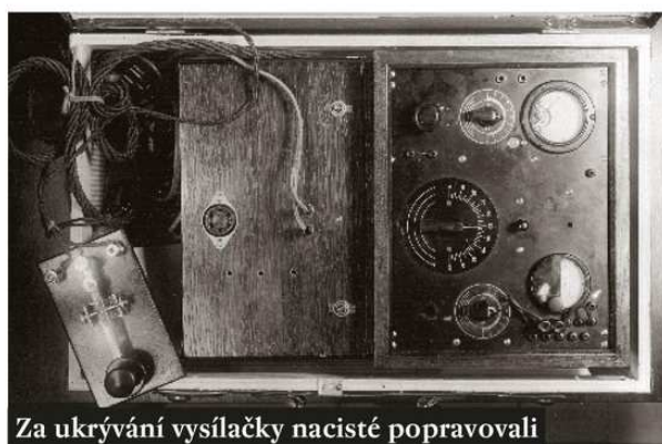
Za ukryvání vysílačky nacisté popravovali

V červnu 1943 se divadlo dostalo z pochopitelných důvodů do hledáčku gestapa. Divadelní autobus byl dle všeho dvakrát útočištěm pro vysílačku ilegální skupiny v Chrástu a zřejmě se používal i k opakovanému převozu zbraní. Proto také v lednu 1944 Skupu zatkli a nemilosrdně vyslýchali. A i když vyšetřovatelé nezískali žádné relevantní důkazy, stejně ho odsoudili jako „nebezpečnou osobu“ k pěti letům vězení . Jak to? Prý za poslech zahraničního rozhlasu. Skupa si svůj trest odpykával v Drážďanech. Když byla věznice 14. února 1945 při náletu amerických letadel zasažena, podařilo se mu z hořící budovy prchnout.