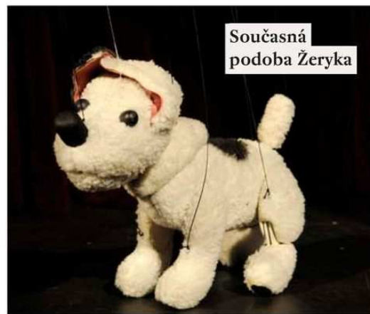
Současná podoba Žeryka