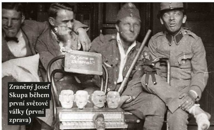
Zraněný Josef Skupa během první světové války (první zprava)

Josef Skupa byl už od útlého dětství nadšencem do divadla. Jeho studia na uměleckoprůmyslové škole ale přerušila 1. světová válka. A tak mladému muži nezbývalo, než narukovat – ovšem i jako voják na frontě bavil sebe a ostatní krátkými výstupy nejen s jednoduchými maňásky.