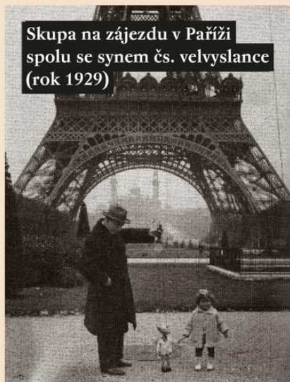
Skupa na zájezdu v Paříži spolu se synem čs. velvyslance (rok 1929)

Divadlo Spejbla a Hurvínka během své historie reprezentovalo českou loutkařskou tradici a kulturu po celém světě. Do dnešního dne soubor navštívil třicet čtyři zemí na čtyřech kontinentech a loutky promluvily dvaadvaceti jazyky.