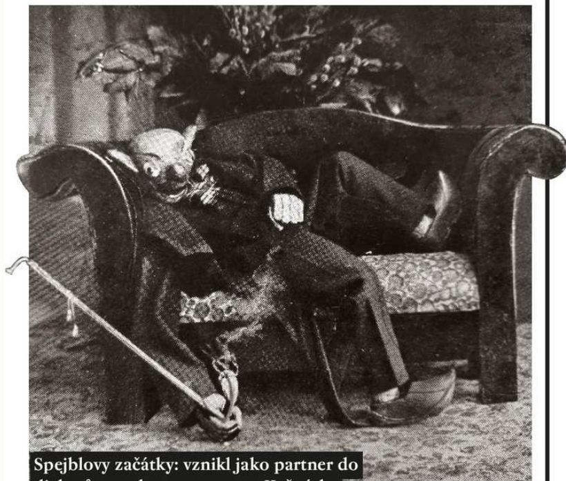
Spejblovy začátky: vznikl jako partner do dialogů pro slavnou postavu Kašpárka