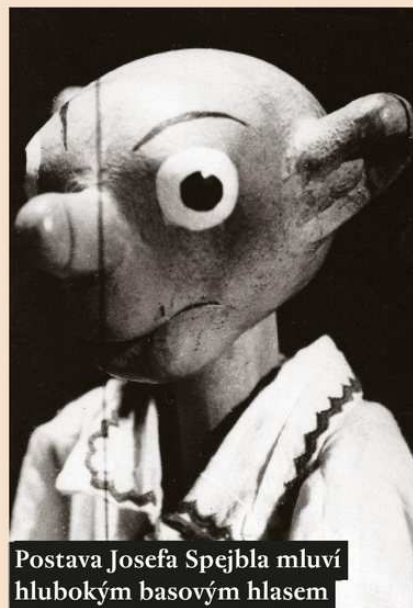
Postava Josefa Spejbla mluví hlubokým basovým hlasem

Loutka Spejbla je tradičně oděná do umolousaného fraku, ovšem na nohou má prosté dřeváky. Stále s něčím nespokojený a věčně všechno pletoucí bručoun rád předstírá nebývalý světový přehled, čímž se opakovaně usvědčuje z nevědomosti až hlouposti.