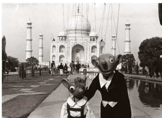
Slavné postavičky se většinou snažily mluvit jazykem země, kde vystupovaly

V březnu roku 1953 postihl Skupu infarkt, a tak ho na festivalu v Bukurešti musel zaskočit Miloš Kirschner. Před odjezdem se zašel se Skupou poradit, jak Spejbla s Hurvínkem publiku představit, dostalo se mu však jen dost strohé odpovědi: „Hraj si to, jak chceš! Oni ti budou stejně hovno rozumět!“ Kirschner se proto rozhodl nechat loutky mluvit nad rámec běžné zdravotce . Cestou mu s překladem dialogů hned do několika světových jazyků pomohli spolecestující z vlaku – cestovatelé Hanzelka a Zikmund a houslový virtuós Josef Suk, kteří také mířili do Rumunska prezentovat československou kulturu. Když taťulda se synátorem promluvili na publikum v několika světových jazycích, byla z toho taková sláva, že se místo osmi představení muselo hrát třináct.