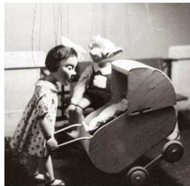
Mánička ve třicátých letech 20. století – tato unylá podoba jí vydržela až do šedesátých let