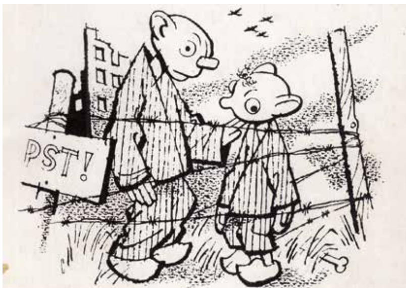
Spejbl a Hurvínek v rozbombardovaných Drážďanech. Symbolická kresba Vojtěcha Cinybulka, 1948. Repro: VAVRUŠKA, Eduard: Loutky za ostatným drátem

Po organizačně-provozní stránce se toho pro divadlo příliš neměnilo. Zhruba třináctičlenný soubor kompenzoval ztrátu štací v pohraničí navýšením počtu vnitrozemských vystoupení a nastudoval stejně jako v době první republiky ročně jednu novinku pro dospělé a jednu pro děti. V letech 1939–1944 odehrál celkem 1345 představení, která navštívilo