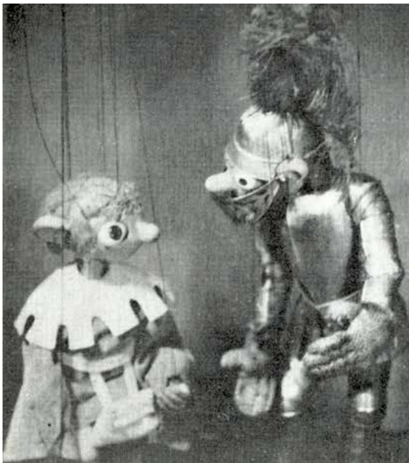
Spejbl a Hurvínek se přenesli v čase do středověku. Fotografie ze hry „Ať žije zítřek“, jejíž námět se stal předmětem zájmu pražského Sicherheitsdienstu.

Jaký význam se přikládá loutkovému divadlu v národním odboji a v jakém duchu se tato kulturní činnost ode-