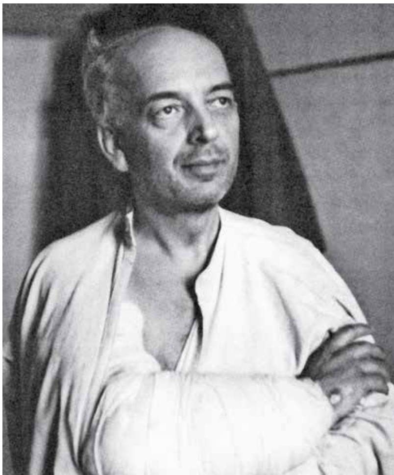
Josef Skupa v roce 1944 na nemocničním oddělení německé soudní věznice v Plzni

Po jednom představení na Příbramsku (OLB Praha) se jedna žena na loutkové scéně zeptala rytíře, jaké je dnes datum. Na jeho odpověď „6. března!“ odvětila „Myslíte ještě na to, že musíte splnit slib, který jste mi dal před rokem na mé narozeniny?“ Toto místo bylo obecně pochopeno jako narážka na Masarykovy narozeniny (7. 3.) a na známá slova [prezidenta] Beneše, že naplní Masarykův odkaz.