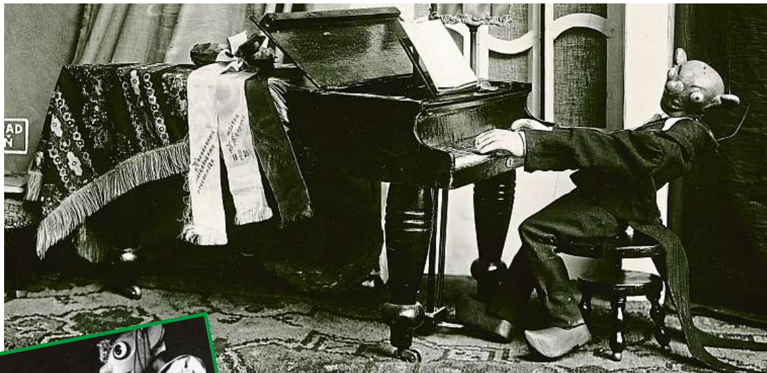
Josef Spejbl za klavírem na jednom z prvních dobových snímků v počátku kariéry. Na fotce vlevo Josef Skupa se svými loutkovými přáteli.

S paní Kateřinou jste měl v roce 1939 problémy, chtěla vás připravit o váš dům, že? Tak to bylo ve hře „Kolotoč o třech poschodích“, jejíž premiéra byla 10. února 1939 a Skupa tak reagoval na okupaci nacisty.