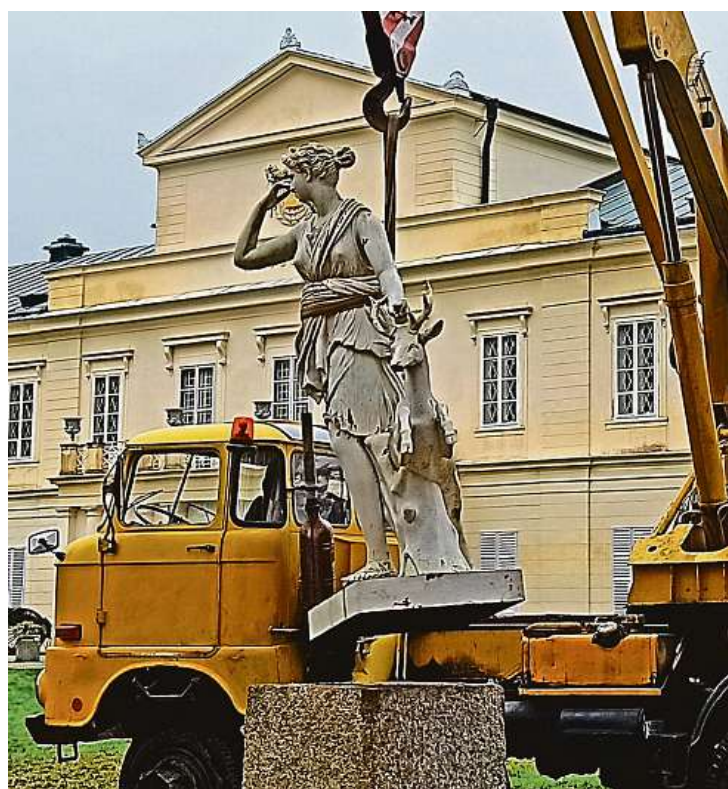
S pomocí jeřábu sundali památkáři litinovou sochu Diany z jejího podstavce a odvezli do restaurátorské dílny.

Podle jeho slov je originál sochy připisován slavnému athénskému sochaři Leocharesovi ze 4. století před naším letopočtem, slavnému umělci, jehož dílo